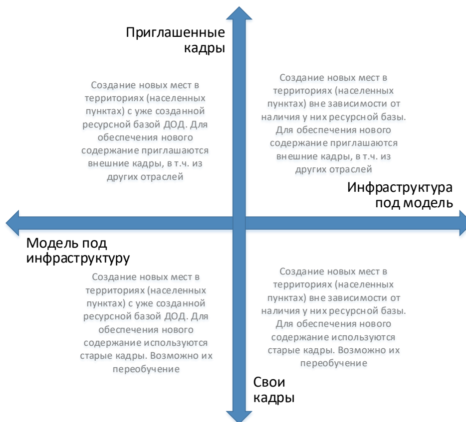
Рис. 6. Шкалы выбора модели инфраструктурного и кадрового обеспечения для типовой модели создания новых мест дополнительного образования

Следует отметить, что механизмы инфраструктурного и кадрового обеспечения не существуют в их полярных вариантах. Решения даже в рамках реализации одной модели будут различны. Анализ перечисленных выше характеристик позволяет сделать эти точечные решения более точными и эффективными.