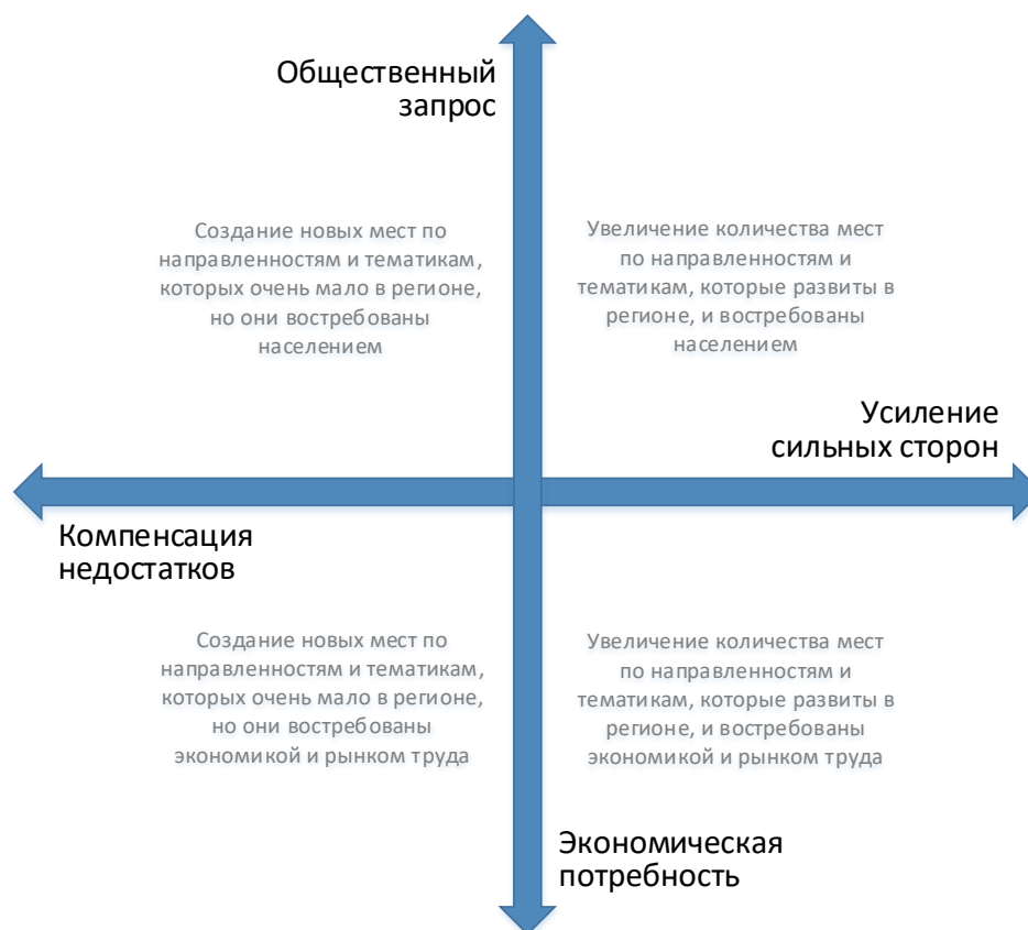
Рис. 2. Шкалы выбора тематики и тактики создания новых мест дополнительного образования