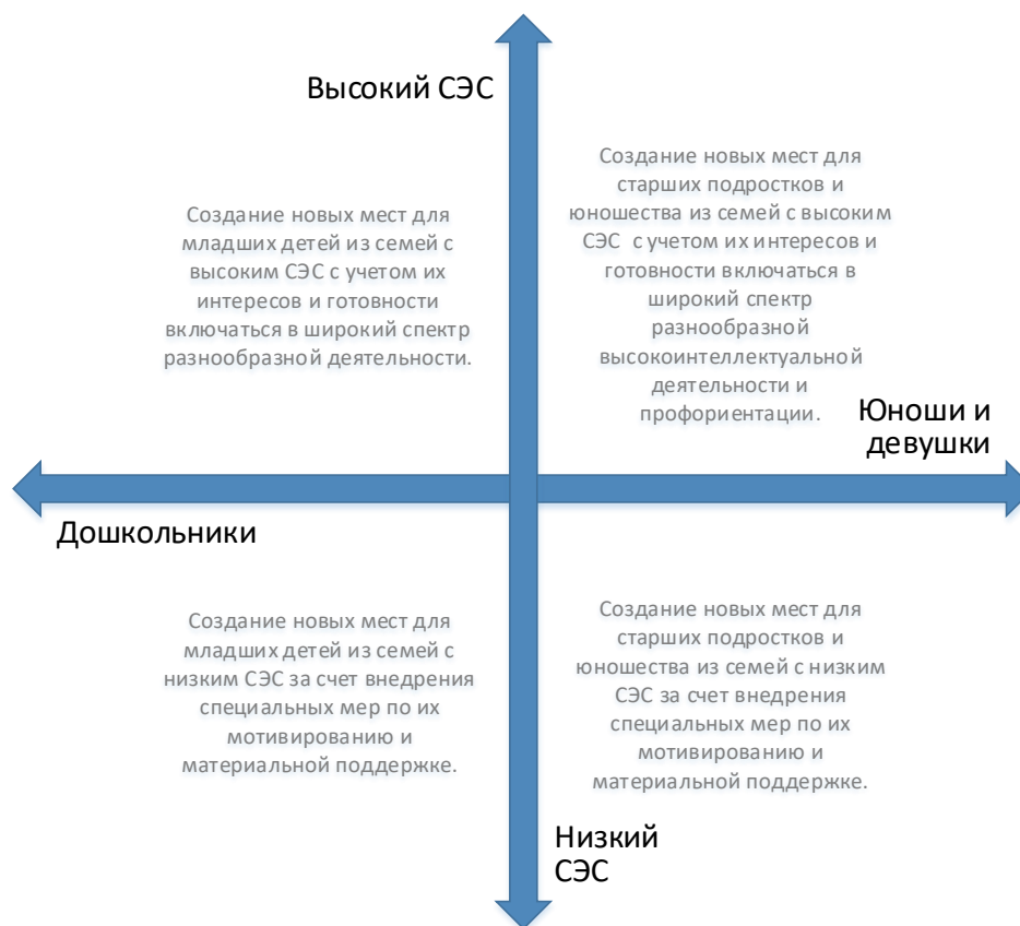
Рис. 5. Шкалы выбора модели создания новых мест по программам художественной направленности с учетом особенностей контингента обучающихся

Вовлечение в программы детей из семей с низким образовательным и культурным уровнем потребует осуществления определенных PR-шагов, поиска мотиваторов для данных детей, в том числе, материальных.