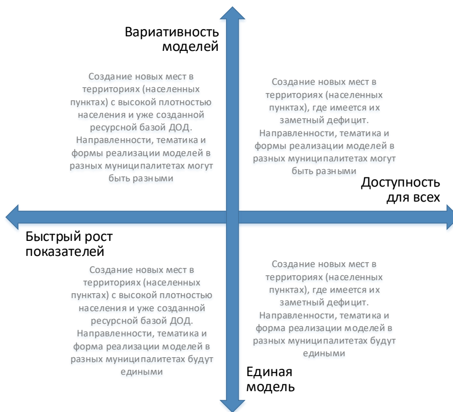
Рис. 4. Шкалы выбора модели создания новых мест с учетом актуальной управленческой политики