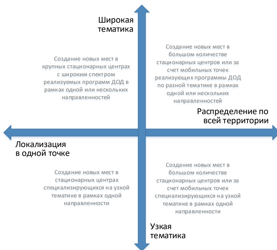
Рис. 3. Шкалы выбора масштаба и формы реализации новых мест по программам ДОД

При невыполнении хотя бы одного из них возникает необходимость пространственного распределения реализуемой модели через мобильные или сетевые решения.